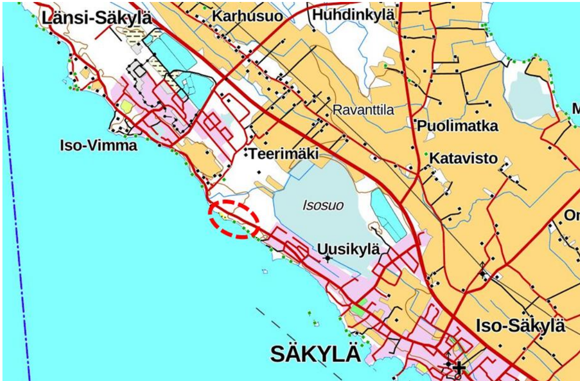
Kuva 3-1. Asemakaavoitettavan alueen sijainti.