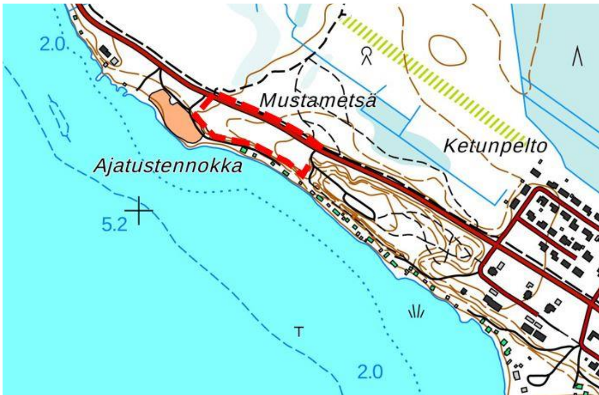
Kuva 3-2. Kaava-alueen suurpiirteinen rajausta punaisella katkoviivalla.

Alue sijaitsee muulla pohjavedenhankintakäyttöön soveltuvalla pohjavesialueella (2), Uusikylä (0278302). Pyhäjärvi on linnustollisesti arvokasta Natura-alueita (SAC/SPA) ja kuuluu valtakunnalliseen lintuvesiensuojeluohjelmaan.