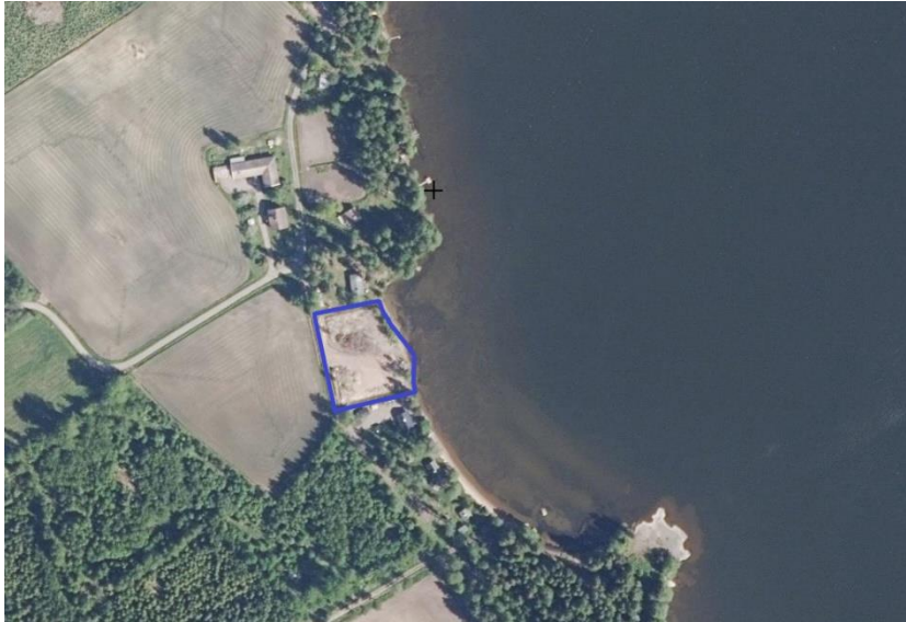
Suunnittelualueen likimääräinen rajausta osoitettu sinisellä. Kartta: Maanmittauslaitoksen ortoilmakuva, © MML.

Suunnittelualueen likimääräinen rajausta ilmakuvassa: