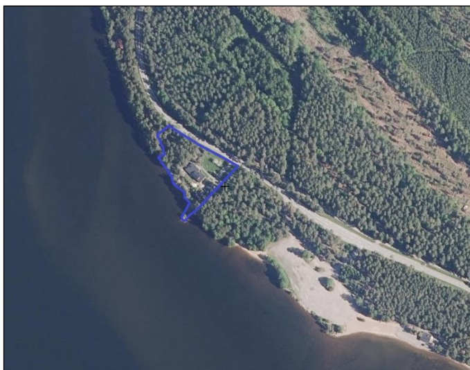
Suunnittelualueen likimääräinen rajaus osoitettu sinisellä.

Suunnittelualueen likimääräinen rajaus ilmakuvassa: