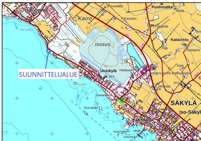
Kartta: Maanmittauslaitoksen maastokartta, © MML.

Suunnittelualueen suurpiirteinen sijainti kartalla: