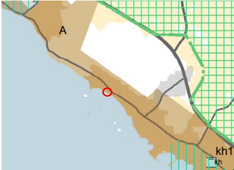
Kuva: Ote Satakunnan vaihemaakuntakaavasta 2. Asemakaavamuutosalueen sijainti on merkitty kuvaan punaisella ympyrällä.

välttää. Taajamatoimintojen alue ei ole ensisijaisesti tarkoitettu tilaa vaativan kaupan suuryksikköjen sijoittumisalueeksi. Kaupan suuryksiköiden mitoitus tulee yksityiskohtaisemmassa suunnittelussa määrittellä paikallisen ostovoiman pohjalta ja yksiköiden toteutumisen ajoitus tulee yksityiskohtaisemmassa suunnittelussa sitoa muun taajamarakenteen ja liikennejärjestelmien toteutukseen.