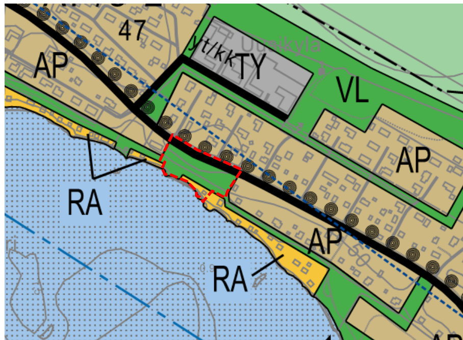
Kuva: Ote Säskylän osayleiskaavasta. Suunnittelualan sijainti on osoitettu punaisella katkoviivalla.

Muilta osin noudatetaan voimassa olevaa rakennusjärjestystä.