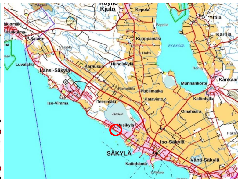
Kuva: Asemakaava-alueen sijainti.