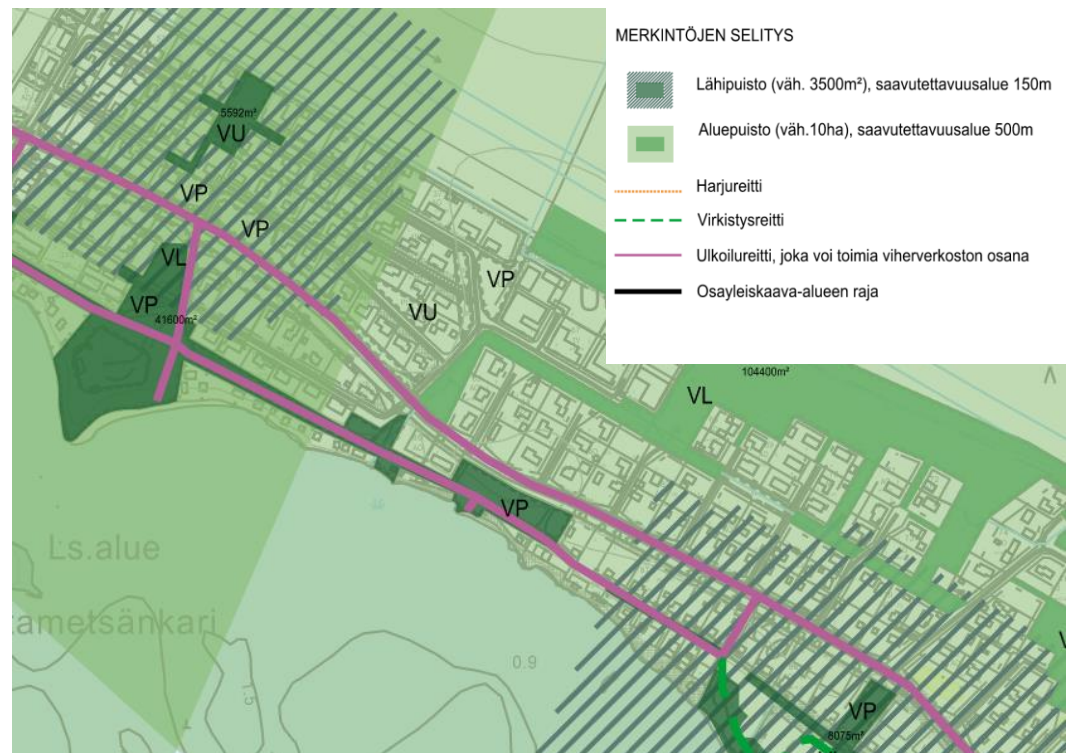
Kuva: Viheralueiden riittävyystarkastelu, Liite 2. (Tengbom Eriksson arkkitehdit Oy, 2015)

Asemakaavan muutosalueella ei sijaitse vakituista asutusta. Alueella sijaitsee yksi loma-asunto.