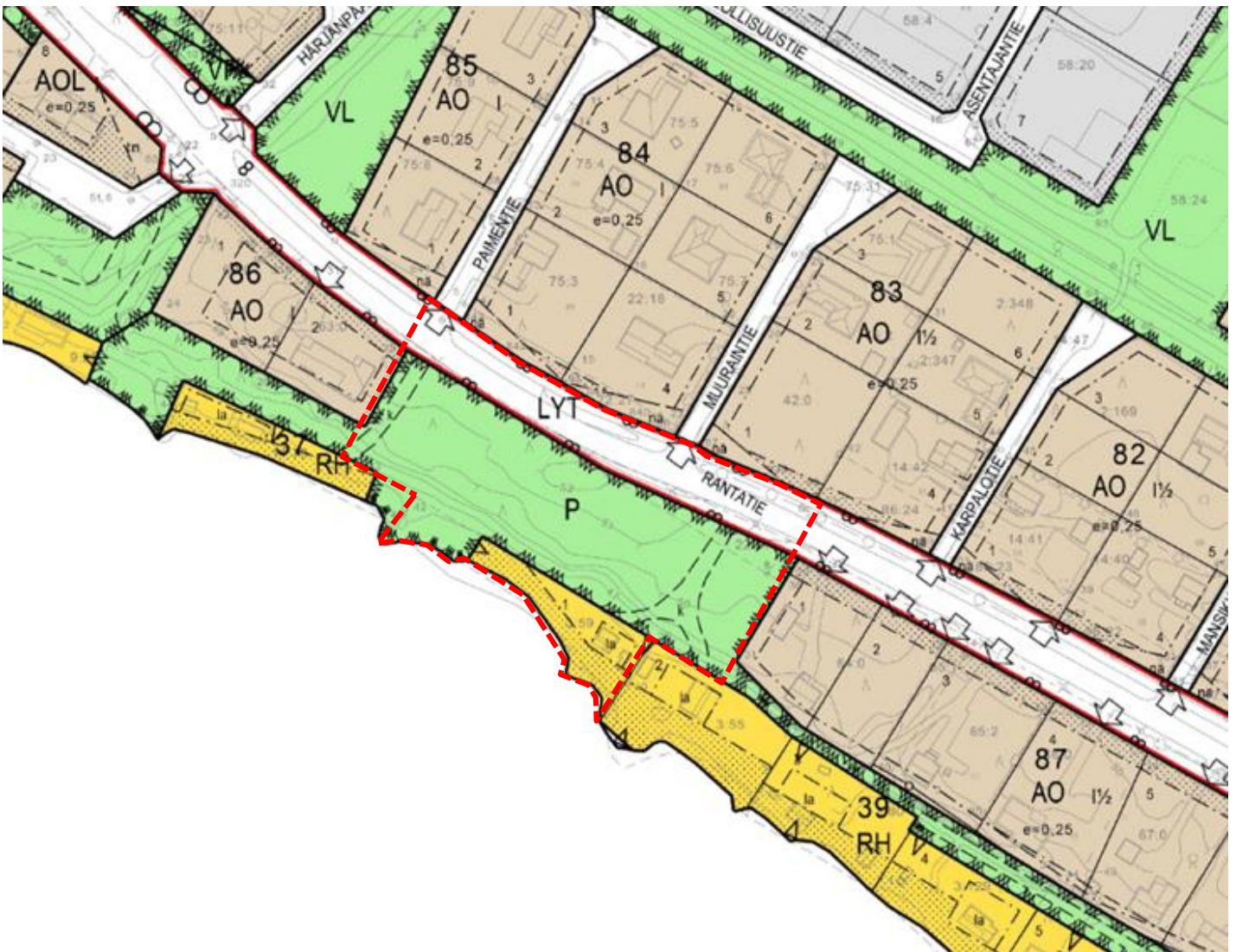
Kuva: Ote Säskylän ajantasa-asemakaavasta.