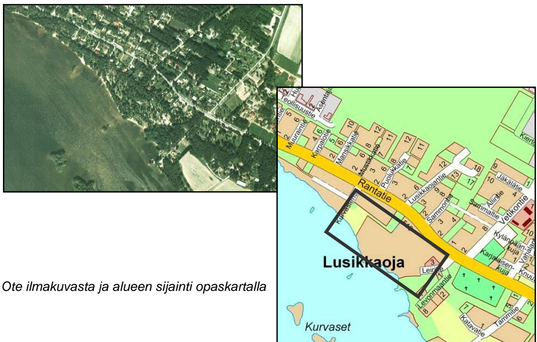
Ote ilmakuvasta ja alueen sijainti opaskartalla

Asemakaavan tavoitteena on osoittaa alueelle omakotiasumista sekä vapaa-alueita. Ranta on tarkoitus säilyttää yhteisenä virkistysalueena, johon osoitetaan mm. ulkoilureittejä. Myös kevyen liikenteen yhteyshähdollisuus hautausmaan ja keskustan suuntaan tutkitaan.