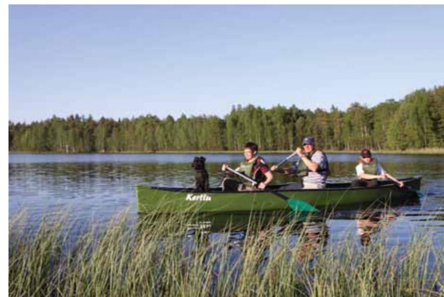
Metsäjärvellä on hauska meloa.