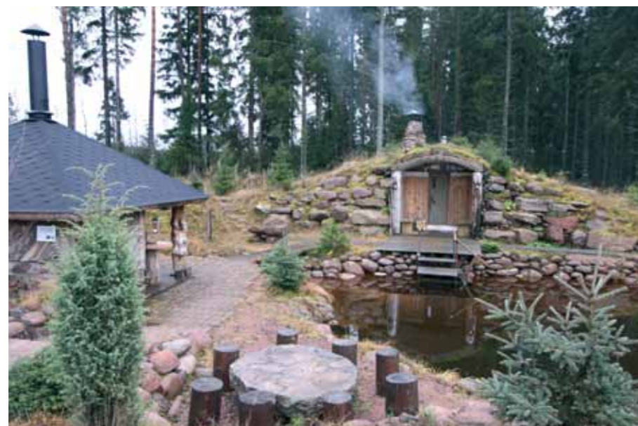
Elämyskeskus Kaarnikan sauna ja pulahduslampi.