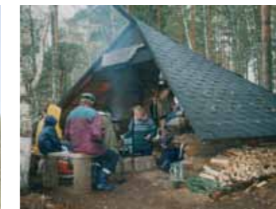
Karpalon laavulle on mukava tehdä eväsretkiä.

Metsäjärvi ja sen tuntumassa oleva Pikku Metsäjärvi ovat ainutlaatuisia luontokohteita ja ne sijaitsevat yksityisten mailla. Metsäjärven itäpuolella on Kankaanpään kyläyhdistyksen rakentama laavu, joka on kuntoilijan käytettävissä. Laavulla on kahvipannu ja paistinpannu, juomavesi pitää kuntoilijan ottaa mukaansa. Noudata tulenteossa varovaisuutta ja kulovaritusohjeita. Noin 200 metriä ennen Metsäjärven pysäköintipaikkaa, tien oikealla puolella on sijainnut v.1946 – 1955 Helsingin yliopiston Karpalotutkimusasema, mistä ovat rakennuksen rauniot näkyvillä. Läheiseltä suolta voi löytää vielä Amerikasta tuotuja pensaskarpaloita.